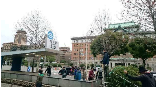
名城線市役所駅4番出口は「霞が関駅」へ