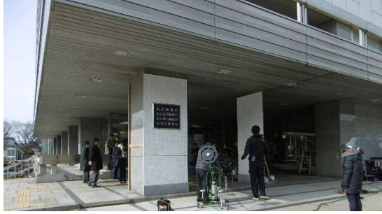
県・西庁舎は「東京地検」へ