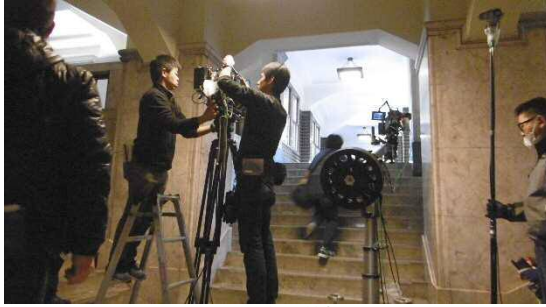
名古屋市役所は「首相官邸」へ