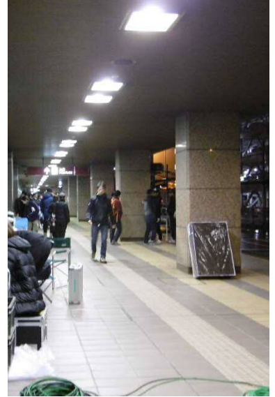
県営名古屋空港は「羽田空港」へ